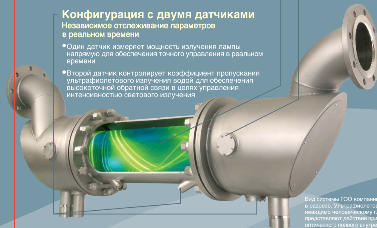
Вид системы ГОО компании Atlantium в разрезе. Ультрафиолетовое излучение невидимо человеческому глазу; лучи света представляют действие принципа волоконно-оптического полного внутреннего отражения.